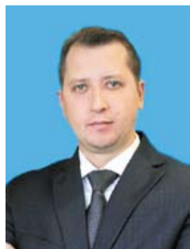
Уважаемые коллеги! Друзья!

В университете учатся талантливые студенты, обладающие прекрасным потенциалом, которые способны сохранить все лучшее и значительно приумножить успехи вуза, применять новые